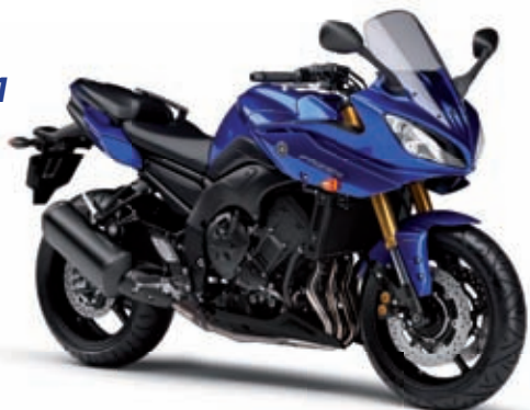
FAZER 8 '11 8499 € TTC