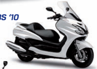
Majesty 400 ABS '10 7349 € TTC