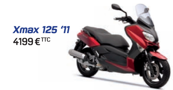
Xmax 125 '11 4199 € TTC