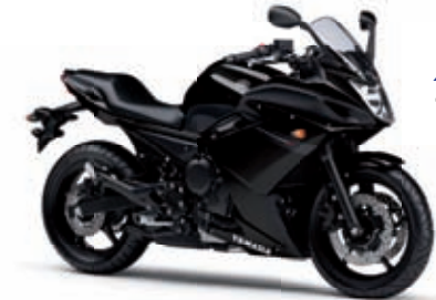
XJ6 DiversionF '10 7199 € TTC