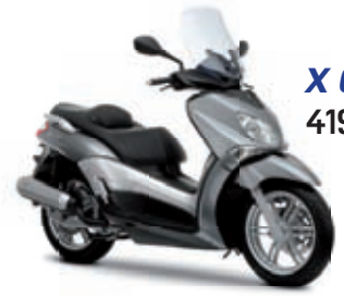
X City 125 '10 4199 € TTC