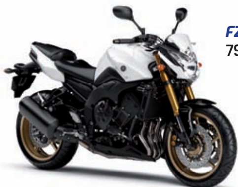
FZ8 '11 7999 € TTC