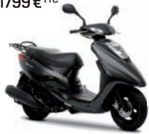
Vity 125 '10 1799 € TTC