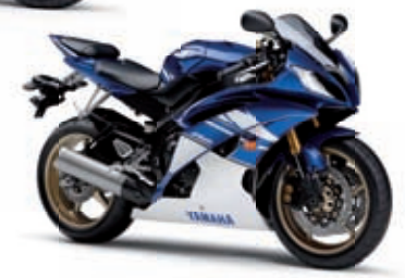
YZF-R6 '10 11499 € TTC