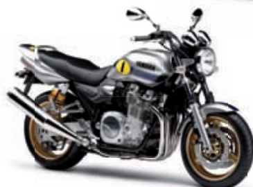
XJR 1300 '10 9999 € TTC