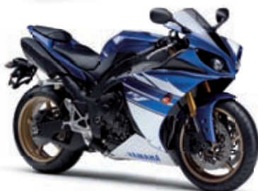
YZF-R1 '10 13999 € TTC