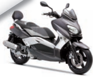
Xmax 125 Sport '11 4499 € TTC