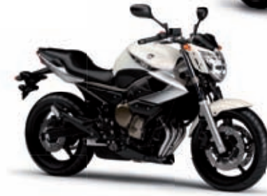
XJ6 N '10 5999 € TTC