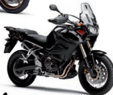
XTZ1200 '11 13990 € TTC