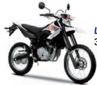
WR 125 R '10 3799 € TTC