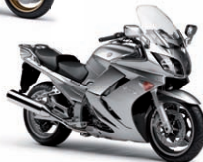
FJR 1300 '11 16999 € TTC

*Reprise de votre ancien véhicule par votre concessionnaire participant, aux conditions d'état et de kilométrage standards selon les critères définis par la côte publiée par L'Officiel du Cycle, de la Moto et du Quad. Ce montant peut varier en fonction de l'état et du kilométrage de votre véhicule, montant exact de la reprise déterminé par votre concessionnaire Yamaha participant **Offre accessoires valable pour l'achat d'un véhicule Yamaha neuf avec reprise de votre ancien véhicule, valable sur l'intégralité de la gamme accessoires disponible chez le concessionnaire participant à l'opération. Opération non cumulable avec une autre offre promotionnelle. Offre valable du 20 janvier au 20 mars 2011. Prix TTC publics maximum conseillés au 02/11/2010. Document et photos non contractuels.