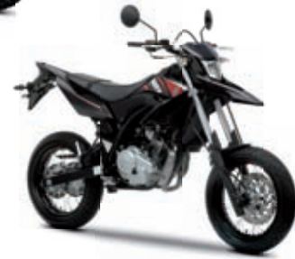
WR 125 X '10 3799 € TTC