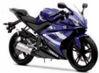
YZF-R125 '11 4299 € TTC