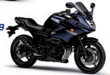
XJ6 Diversion '09 5799 € TTC