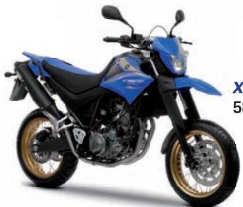
XT660X '10 5899 € TTC