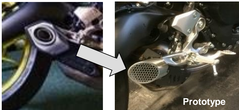
Sortie d'échappement d'origine Sortie d'échappement style Moto-GP