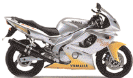
YZF 600R Thundercat

En cette année 1996 Yamaha propose une refonte totale de sa TDM 850 et cinq nouveautés importantes avec les modèles TRX 850, YZF 600R Thundercat, YZF 1000R Thunderace, YP 250 Majesty et SZR 660. Le bicylindre TRX et le mono SZR vont connaître un succès d'estime plus que commercial. Les deux nouvelles sportives YZF qui remplacent respectivement la FZR 600 et la FZR 1000 ne vont pas non plus connaître le succès escompté, principalement à cause d'un design novateur qui ne séduit pas les amoureux de motos sportives. Certes les ventes sont bonnes mais elle n'atteignent pas les premières places comme par le passé les FZR.