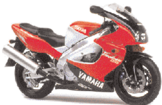
YZF 1000R Thunderace