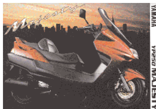
YAMAHA YP250 MAJESTY