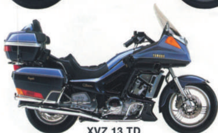
XVZ 13 TD