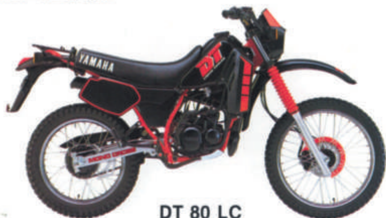
DT 80 LC

• Monocylindre, 2 temps, admission par clapets • Suspension arrière Mono-amortisseur • Frein avant et arrière à tambour • Allumage à décharge de condensateur • Graissage séparé.