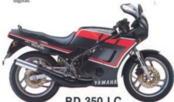
RD 350 LC

Moteur 4 cylindres en ligne • 4 temps, refroidissement liquide, double ACT, 5 soupapes par cylindre • Carénage intégral aérodynamique • Trois freins à disques • Allumage électronique à contrôle digital • Suspension arrière Monocross à flexibilité variable • Pot d'échappement 4 en 1.