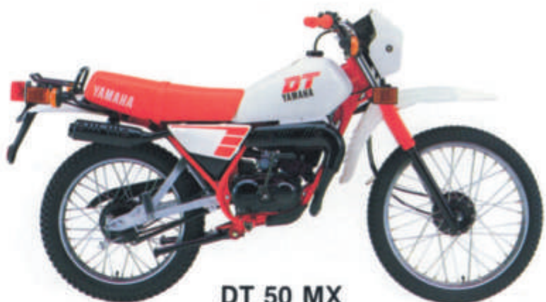
DT 50 MX

• Monocylindre, 2 temps, refroidissement liquide, admission par clapets • Frein avant à disque • Suspension arrière Monocross à flexibilité variable • Allumage électronique • YEIS • Graissage séparé.