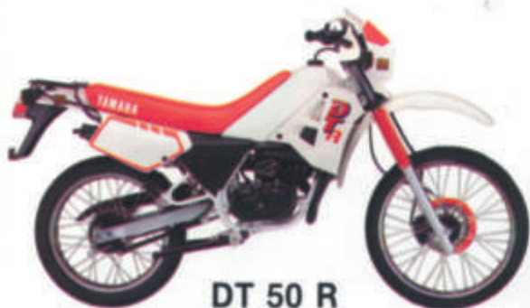
DT 50 R

• Monocylindre, 2 temps, admission par clapets • Suspension arrière Monocross • Graissage séparé • Plaque phare.