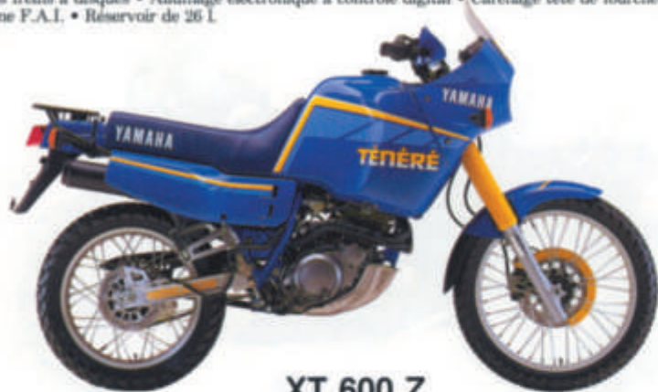
XT 600 Z