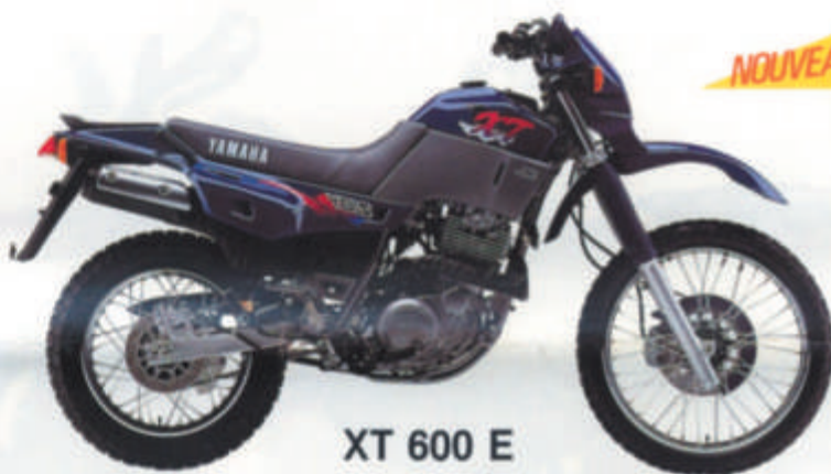
XT 600 E