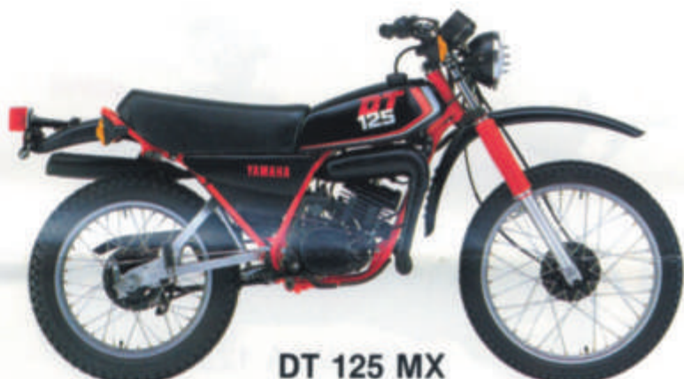
DT 125 MX

• Monocylindre, 2 temps, refroidissement liquide, admission par clapets, YPVS, YEIS • Fourche avant à grand débattement • Frein avant à disque • Suspension arrière Monocross à flexibilité variable • Graissage séparé.