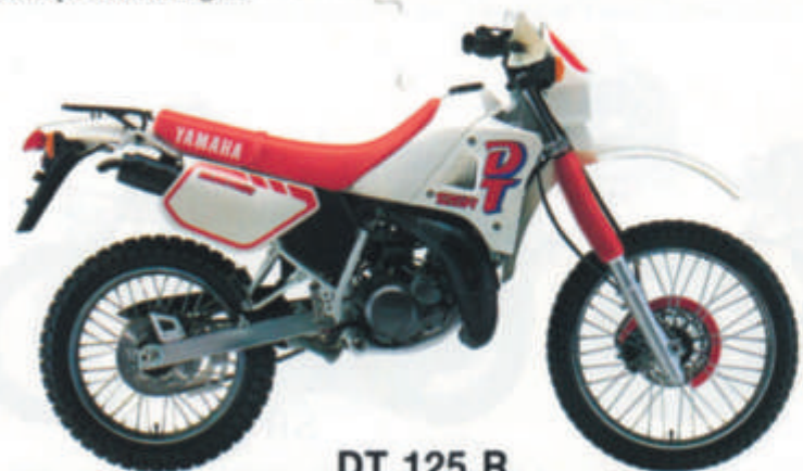
DT 125 R