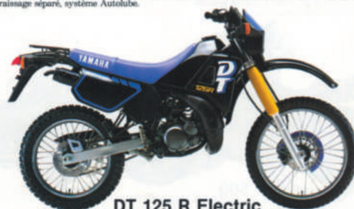
DT 125 R Electric