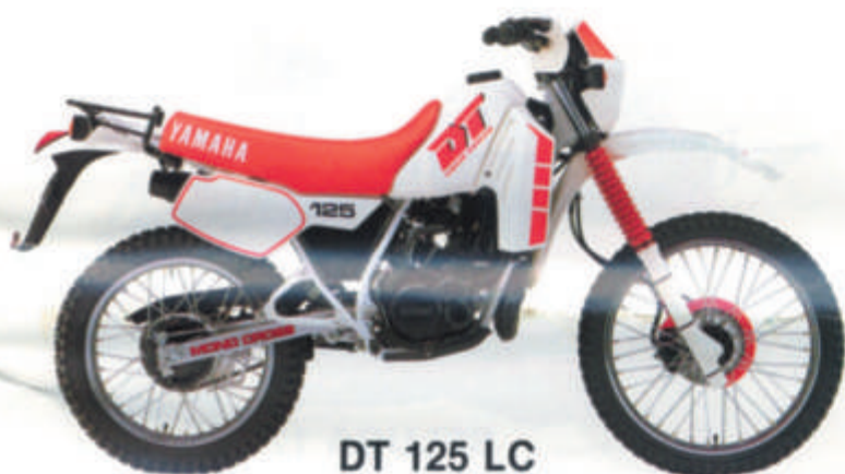
DT 125 LC

• Monocylindre, 2 temps, refroidissement liquide, admission par clapets, YPVS, YEIS • Fourche avant à grand débattement • Frein avant à disque • Suspension arrière Monocross à flexibilité variable • Graissage séparé.