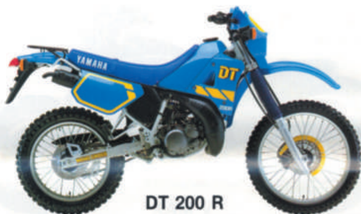
DT 200 R