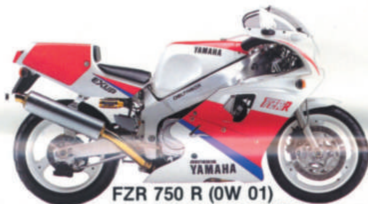
FZR 750 R (0W 01)

Moteur 4 cylindres en ligne • 4 temps, refroidissement liquide, double ACT, 5 soupapes par cylindre • EXUP • Cadre Deltabox et bras oscillant aluminium • Trois freins à disques • Jantes alliage à branches creuses et pneus larges à structure radiale • Fourche avant de 43 mm avec système de réglage en précontrainte • Carénage intégral aérodynamique avec système F.A.I. • Système d'échappement chromé 4 en 1 • Allumage électronique à contrôle digital.