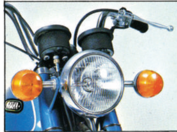
COMPTEURS Compteur, compte tour à lecture immédiate.