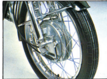
FREINS absolument étanche à l'eau et à la poussière, freinage efficace en toutes circonstances.