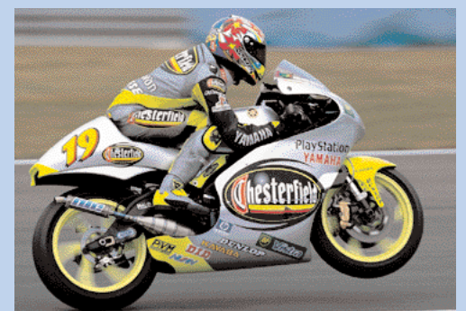
Palmarès Olivier Jacque avec Yamaha

Jacque n'est pas à cent pour cent de ses possibilités physiques et termine septième. En 2000, OJ se classe trois fois quatrième, deux fois deuxième et une fois troisième en cinq Grands Prix. Il gagne ensuite en Catalogne et en Allemagne et finit deuxième en Hollande et en Grande-Bretagne. Mais à Rio, il part à la faute alors qu'il est en tête de la course. A l'aube du dernier GP australien, trois hommes sont en lisse pour la victoire : OJ 254 points, Nakano 252 points et Katoh 243 points. C'est dans le double gauche et la ligne droite de la ligne d'arrivée que tout se joue. A quelques mètres de Nakano Olivier recolle dans le double gauche et déboîte Nakano sur la ligne. Olivier Jacque est champion du monde pour 14 millièmes de seconde.