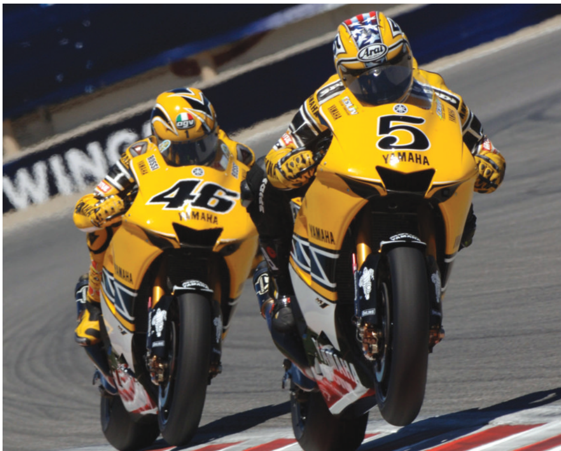
Pour le GP des États-Unis les motos de Rossi et d'Edwards reprennent la décoration jaune et noire des motos du "King" Roberts. Hommage historique.

Pour célébrer les cinquante ans d'existence de la marque Yamaha et ses quarante ans de présence en France, de nombreux événements ont été organisés durant l'année 2005, comme lors des "Coupes moto légende" sur le circuit de Dijon où une exposition des motos de course emblématiques de la marque fut organisée en présence de talentueux pilotes tels Agostini, Read, Sarron, Lansivuori ou encore Kent Andersson. La presse s'est aussi largement fait l'écho de cet anniversaire. Moto Revue, Moto Journal, l'Intégral, La vie de la moto, Moto Légendes, Moto Verte ... ont, parmi d'autres titres, relaté une partie de l'histoire de la marque. Sur internet bon nombre de sites comme celui de Yamaha Japon et particulièrement celui de Yamaha Motor France avec "l'Hebdo du cinquantenaire", ont prévu une rubrique spéciale commémorant cet anniversaire.