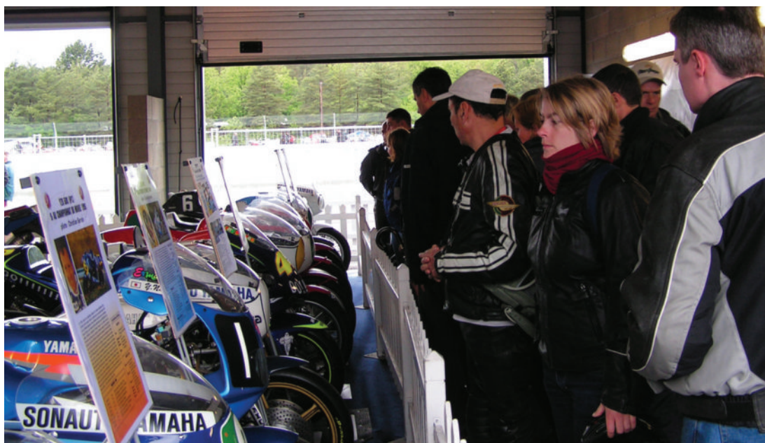
L'exposition des motos de la collection de YMF dans le box Yamaha a rencontré un vif succès lors des Coupes.