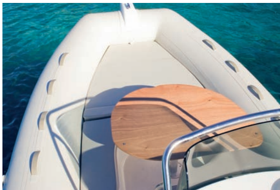
| Tempest 500 Open |