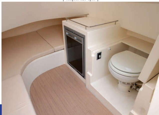
| Tempest 1000 Open |