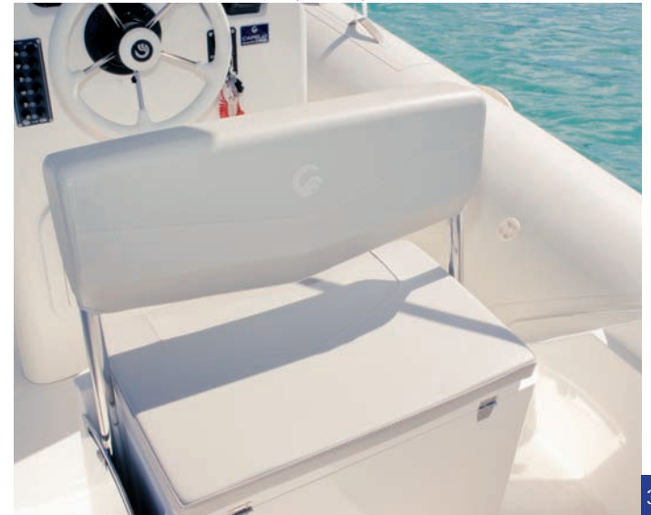
| Tempest 626 Open |