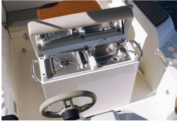
| Tempest 770 WA |