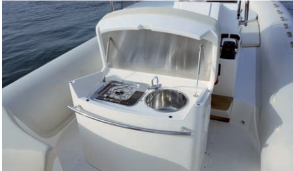
| Tempest 1000 Open |