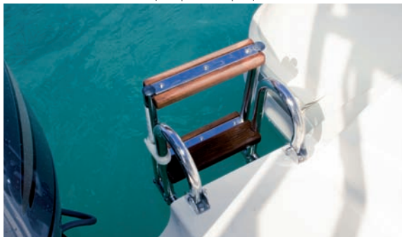
| Tempest 626 Open |