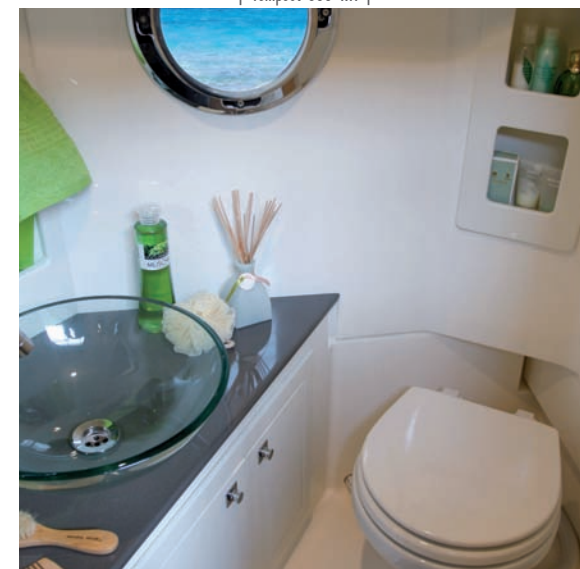
| Tempest 1000 WA |