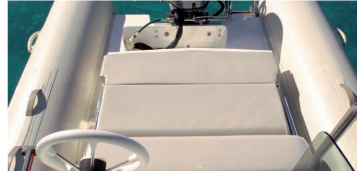
| Tempest 530 Open |