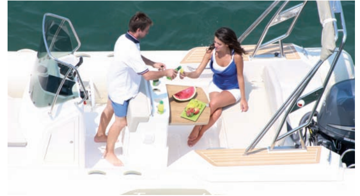
| Tempest 700 Sun |