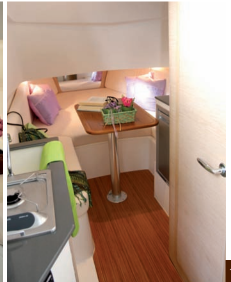
| Tempest 1000 WA |