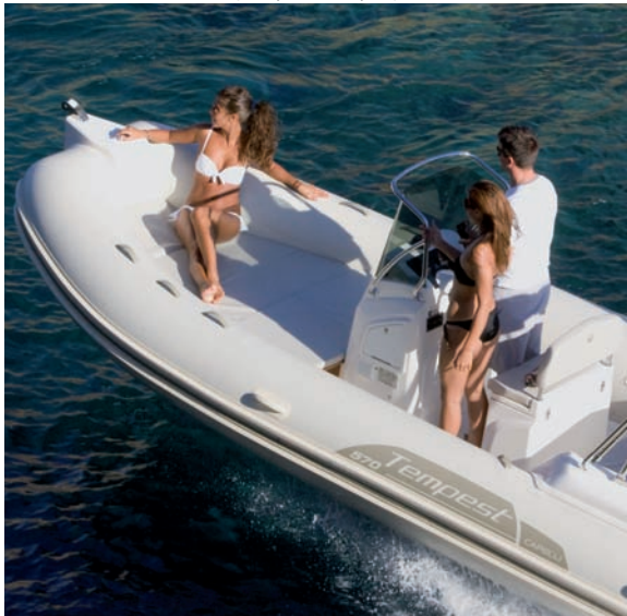
| Tempest 570 Open |