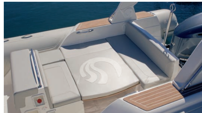
| Tempest 770 Open |