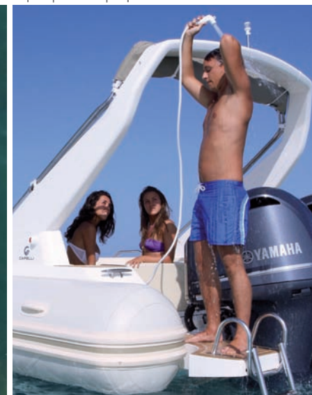
| Tempest 1000 Open |